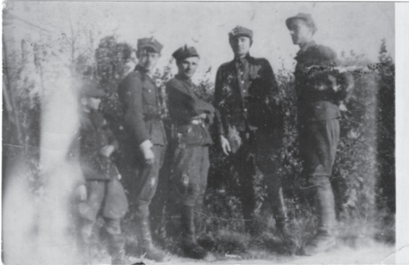
Suvalkų–Augustavo WiN apylinkės partizanai turbūt prieš legalizavimąsi Suvalkuose.

mi didesniu skaičiumi sovietų kareivių, UBP ir milicijos. Į miškus visai nesileidžia. Jų požiūris į civilius gyventojus pastaruoju metu labai pablogėjo. Kiekvienas valsčius yra visiškai pavaldus AK. Jeigu kur nors ir valdo valsčiaus darbuotojai, tai išimtinai su mūsų leidimu. Kiekvienas viršaitis glaudžiai bendradarbiauja su mumis ir vykdo tik mūsų įsakymus (...). Beveik visi laukia momento, kada jau baigsis ta betvarkė ir sovietų valdžios šeimininkavimas. (...) Civiliai gyventojai visiškai simpatizuoja mums. Visi atsišaukimai, biuletiniai ir proklamacijos yra skaitomi entuziastingai. Kiekvienas tik laukia momento, kai galės su ginklu rankoje stoti į kovą už laisvę, už žmogaus ir piliečio teises.“ 13