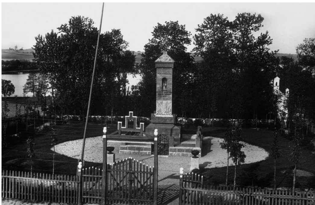
3 pav. Paminklas Lietuvos kariams, žuvusiems 1920 m. Širvintų–Giedraičių–Musninkų mūšyje. 1932 m. Molėtų krašto muziejus .