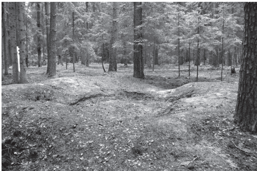
2 pav. Blinstrubiškių miško žeminės duobė, žvelgiant iš pietryčių.

Žeminės duobė 2,8x4,2 m dydžio, iki 0,85 m gylio, pailga šiaurės–pietų kryptimi, jos šiaurinėje pusėje – spėjamo užversto apie 1,4 m pločio, 0,2 m gylio įėjimo griovys (2 pav). Įėjimas 2,5 m ilgio, su 4,4 m ilgio, 0,45 m pločio, 0,4–0,8 m gylio apkasu ir stačiai užlenktu 4,4 m ilgio atsišakojimu ties jo pradžia. Apkaso gale – 1,1x1,1 m dydžio, 0,55 m gylio duobė stacioniais sienelėmis ir plokščiu dugnu. Aplink žeminę supiltas 1,7–2,4 m pločio ties pagrindu pylimas (viename krašte jo žymių neišliko). Dar vienas netaisyklingas 5,8 m ilgio, 0,6–1,4 m pločio, 0,15–0,75 m gylio apardytas apkasas išlikęs į šiaurės vakarus nuo žeminės duobės. Be to, į šiaurę nuo duobės pastebimos kelios 0,9–1,2 m skersmens, 0,3–0,5 m gylio apkasų (?) duobės, pietų pusėje – apskrita 0,9 m skersmens, apie 1 m gylio šulinio duobė.