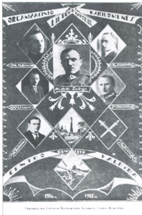
Organizacinis Lietuvos kariuomenės savanorių sąjungos Centro komitetas