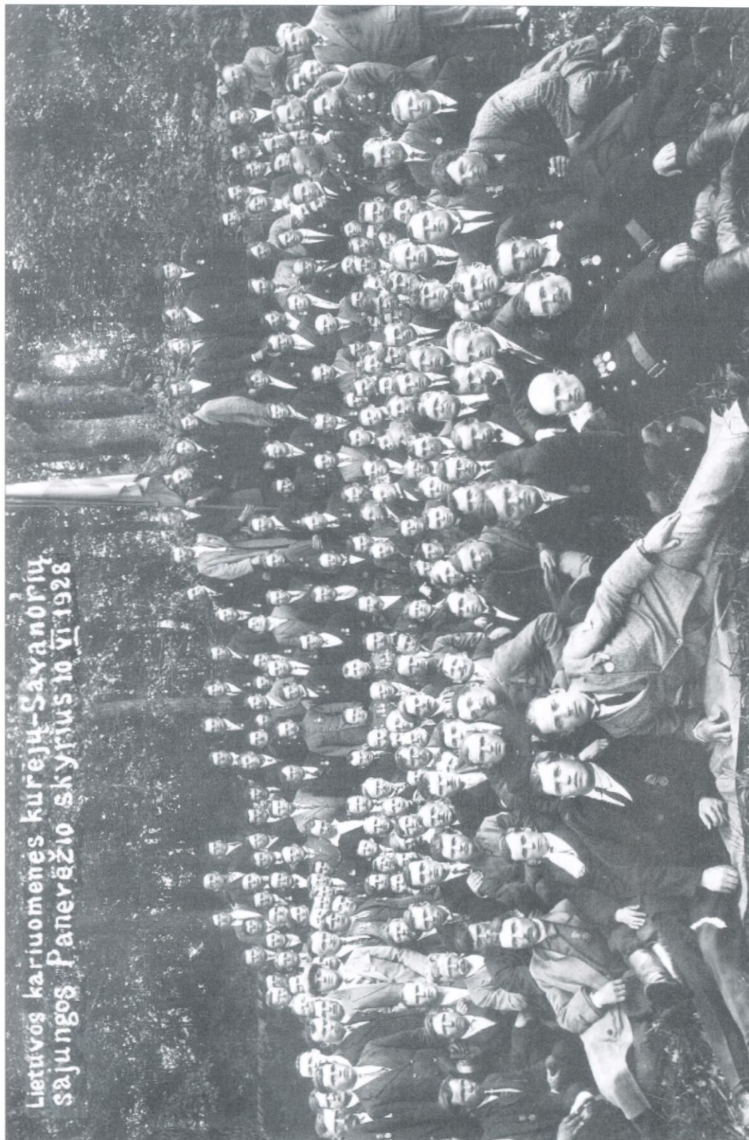
Lietuvos kariuomenės kūrėjų-Savanorių sąjungos Panevėžio skyrius 10 VI 1928