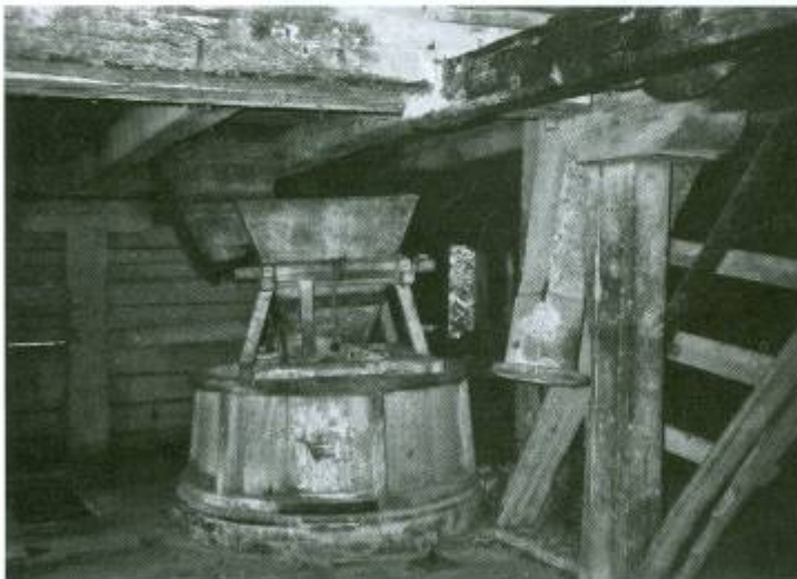
4 pav. Piniavos vandens malūnas apie 1995 m. pradėtas rekonstruoti, po to – sudegė