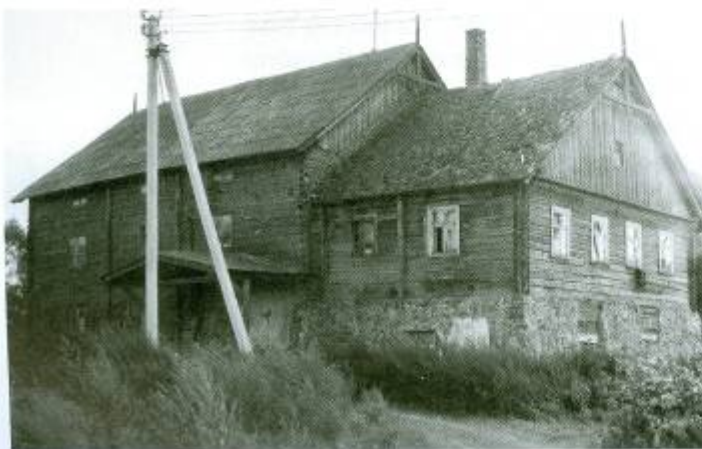
1 pav. Skaistkalnės vandens malūnas apie 1981 metus.