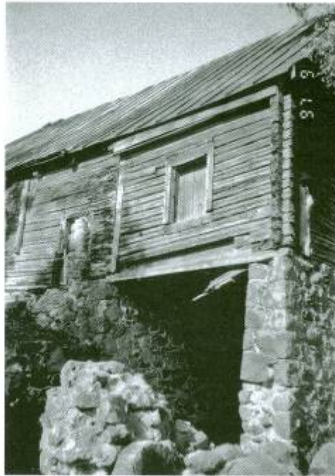
2 pav. Velžio vandens malūnas. 1997 m. nuotr.