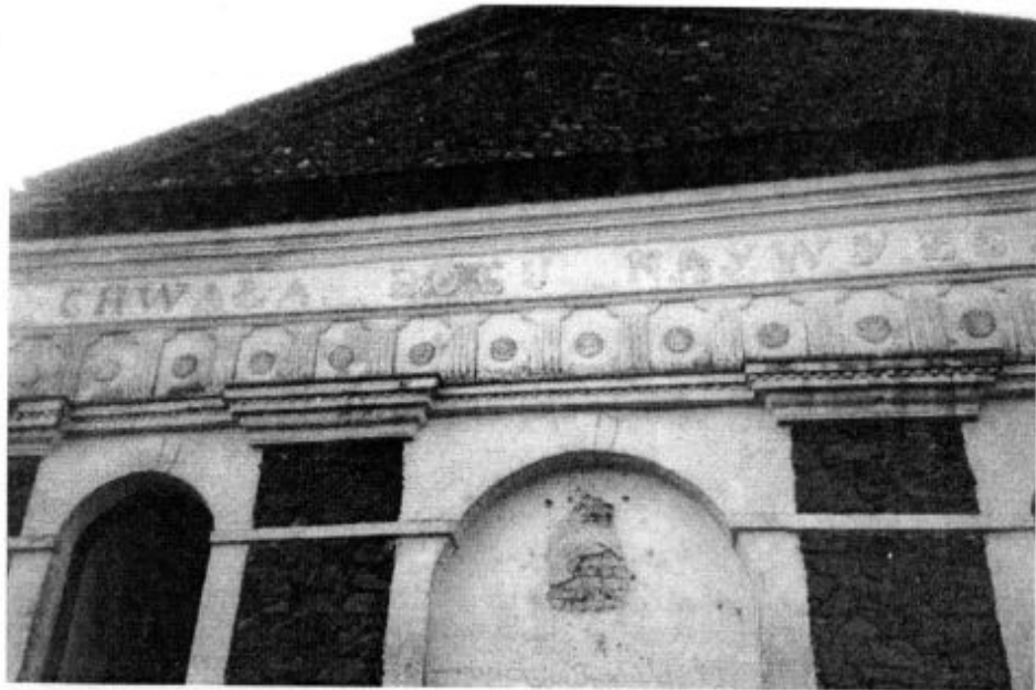
4. Kopyčios fragmentas. AtV 1071