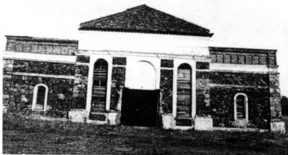
3. Nevėžninkų dvaro koplyčia

Nevėžninkų dvaras istoriniuose šaltiniuose žinomas nuo XVI amžiaus. Iki mūsų dienų išlikę sodybos fragmentai – XIX amžiaus antrosios pusės statiniai. Jei Nevėžninkų dvaro koplyčia į laikinąją kultūros paminklų apskaitą buvo įrašyta 1989 m. spalio mėnesį, tai dvaro sodyba – tik po parko inventorizacijos. Apie dvaro koplyčią (AtV 1071) nemažai rašyta [5]. Pats dvaras dėmesio susilaukė kiek vėliau [6]. Buvusio dvaro parkas inventorizuotas 1990 metais [7]. Dar prieš tai buvo atlikti pirmieji dvaro aprašymai [8]. Nevėžninkų dvaro sodybos fragmentai pateko į antrą buvusių dvarų sodybų inventorizavimo etapą ir 1991 metais buvo įrašyti į išaiškinamų paminklų sąrašą (IP 498/At). Iškilus būtinybei plėsti Panevėžio miesto vandens valymo įrenginius, buvo numatyta iškelti iš tos teritorijos gyventojus, prirėkė spėsti ir čia esančių kultūros paveldo objektų apsaugos problemas. Apie tai daug diskutuota ir spaudoje [9]. 1992 m. buvo parengta dvaro sodybos paminklosauginė užduotis [10]. Atlikus fotogrametrinius apmatavimus, dendrologinius ir archeologinius tyrimus, dvaro sodybą leista nugriauti.