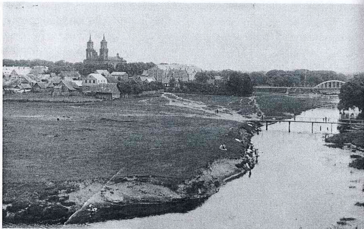
Ištiesinta Nevėžio vaga Panevėžio centre. XX a. 4 dešimtmetis.

Upėvardžių motyvacija sietina ir su gyvūnų pavadinimais. Tokie vardai, matyt, susidarė dėl to, kad gyvūnai, iš kurių pavadinimų kilę upių vardai, galėjo tikrai ar tariamai, nuolat ar tam tikrą laiką gyventi, būti (pvz., plaukioti, maudytis, gerti) vandenyje ar šalia jo. Ažagėlė : liet. ežegys (tarm. ažagys ) ‘pūgžlys ( Acerina cernua )’; Giėglaitis , greičiausiai sutrumpėjusi forma iš Giėgalaitis : liet. giegalas ‘naras’; Guopys : laikomas sutrumpėjusiu iš * Guov-upys , kuris siejamas su latvių gūovs ‘karvė’ 14 ; Ožėliškė : liet. ožėlis , ožys .