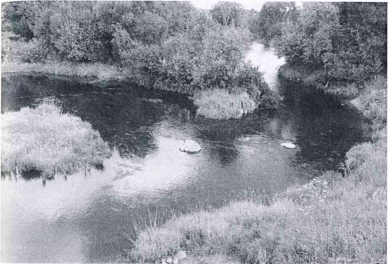
Nevėžis Panevėžio rajone. 2011 m.

upė; Orijà : sietinas su liet. óras 'vieta po atviru dangumi; laukas', galbūt tai per laukus srūvanti upė.