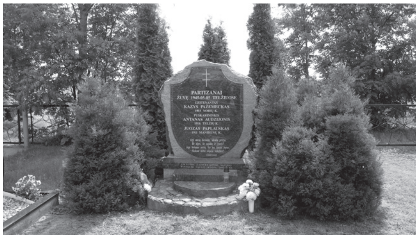
Paminklas Tetirvių kapinėse Telšių kaime žuvusiems partizanams. 2011 m.