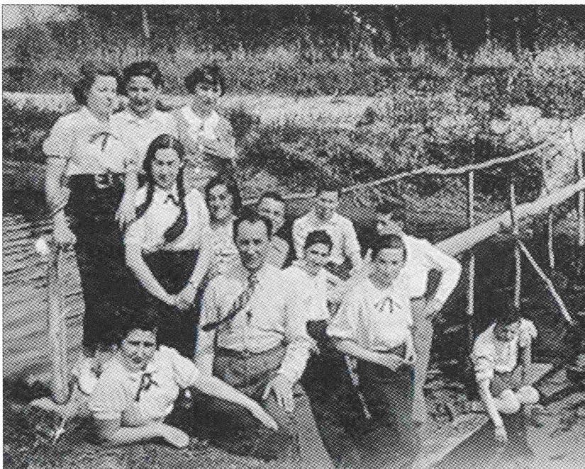
Oraus gyvenimo troškulys: žydų gyvenimo Panevėžyje eskizai