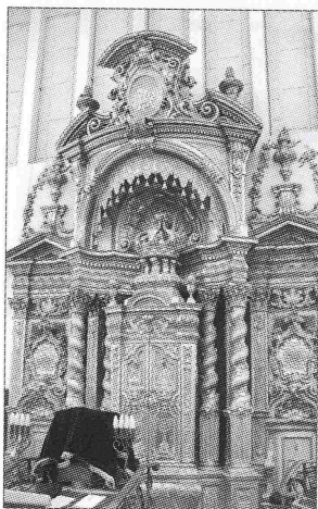
Aron hakodešas (Toros rinkinių saugykla). XVI a. Izraelis, Bene Barakas

rašytus žydų filosofo Haskalos idėjų plėtotės autoriaus Mozės Mendelsono (1773–1786, kompozitoriaus Felikso Mendelsono senelio) Biblijos komentarus. „Istorija, kritinis mąstymas, žinių pasaulis jam suteikė ramybės, naujų žmogiškojo orumo įtvirtinimo galimybių. Galų gale jis susigrąžino sau sielos laisvę.“