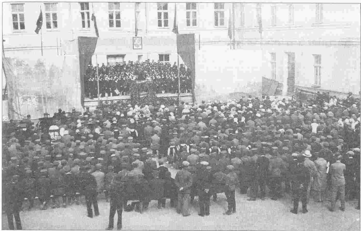
Dainų šventė Panevėžyje. Valstybės berniukų gimnazija. 1943 m.

Šiška), Naujamiesčio, Raguvos, Rozalimo, Šimonių, Troškūnų mokyklų chorai. Dainų švenčių repertuaras – vienas svarbiausių elementų, veikiantis dainuojančiuosius ir šventėje dalyvaujančius klausytojus, žiūrovus, norinčius pritarti skambančiam posmui, pajusti sambūvio svarbą. Galime atsiminti sovietmečio dainų šventes, kai pasibaigus oficialiai programai chorai užtraukdavo visiems žinomas liaudies dainas. Kartais atrodydavo, kad niekam nesiskirstant šventė tęsis iki ryto.