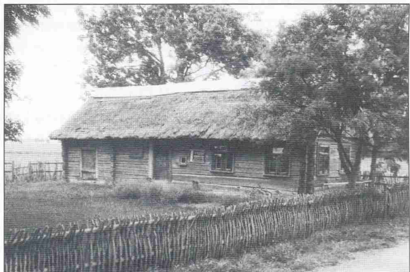
Juozo Zikaro namas-muziejus Paliukų kaime. 1991 m. PAVB RS, f. 27–152.